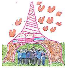
Igual Dá. Viajamos por Europa y sus culturas. PÁGINAS 14-15