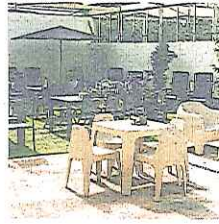
Atades. Brotalia llena de magia el entrañable Día de la Madre. PÁGINA 13