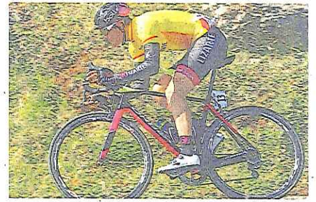
Ojo Avizor. Ciclistas llamando con fuerza a las puertas del cielo. PÁGINAS 2-3