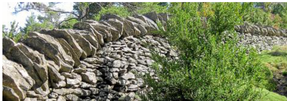
Muros en el corral López de Solanilla