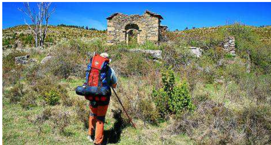
Ermita de San Antón en el mar de 'arizones' de la Pardina de Latorre

sido limpiado recientemente, por lo que no plantea problemas, hasta coronar el cerro.